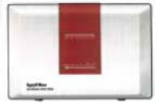
Ein Endgerät Fritz!Box Fon WLAN 7570 VDSL